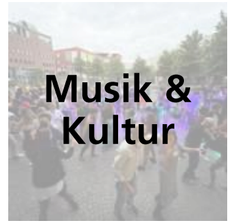
Musik & Kultur